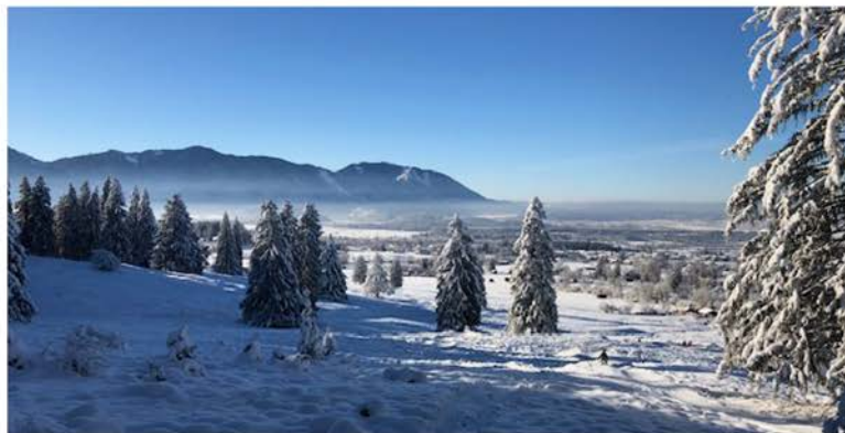
Blick auf Ohlstadt

Wie immer erfolgt die Einladung persönlich. Bitte beachtet, wenn Ihr eine E-Mail Adresse bei der Geschäftsstelle hinterlegt habt, kommt die Einladung nicht per Post, sondern als E-Mail!