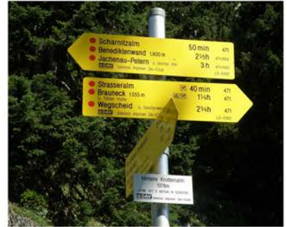
Die fertig montierten Schilder

Die Stadt Bad Tölz hat 2017 das Projekt „Wanderwegkonzept Lenggries / Tölzer Land Süd“ gestartet, das jetzt in 2024 abgeschlossen werden konnte. Ziel ist eine einheitliche Beschilderung des gesamten Wegenetzes im Bereich der teilnehmenden Gemeinden, der Bergbahn und des Deutschen Alpenvereins. Der ASC war beteiligt an der Planung und der Montage der Beschilderung für unser Arbeitsgebiet. Die neuen Schilder wurden endlich zum Sommeranfang 2024 geliefert und konnten nach und nach aufgestellt werden. Ich möchte mich ganz herzlich bei allen ASC-Mitgliedern bedanken, die mir bei dieser ehrenamtlichen Arbeit geholfen haben. Auch die Unterstützung durch die Brauneck Bergbahn gilt es hervorzuheben.