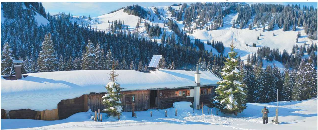
Röthenstein im April 2017