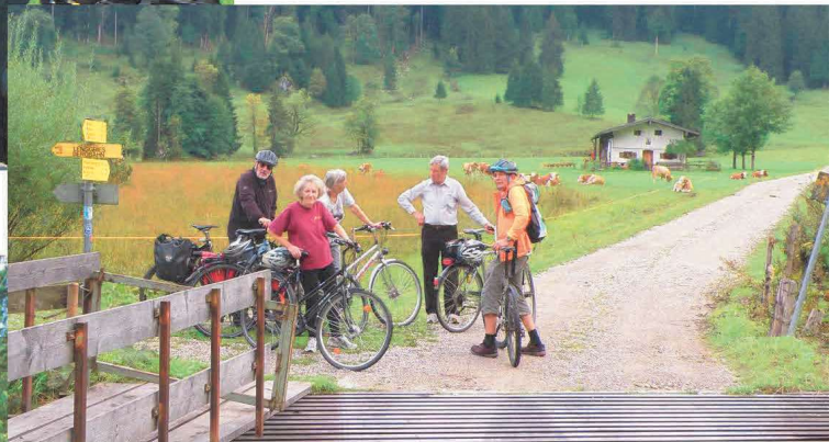
mit dem Rad durch das Längental