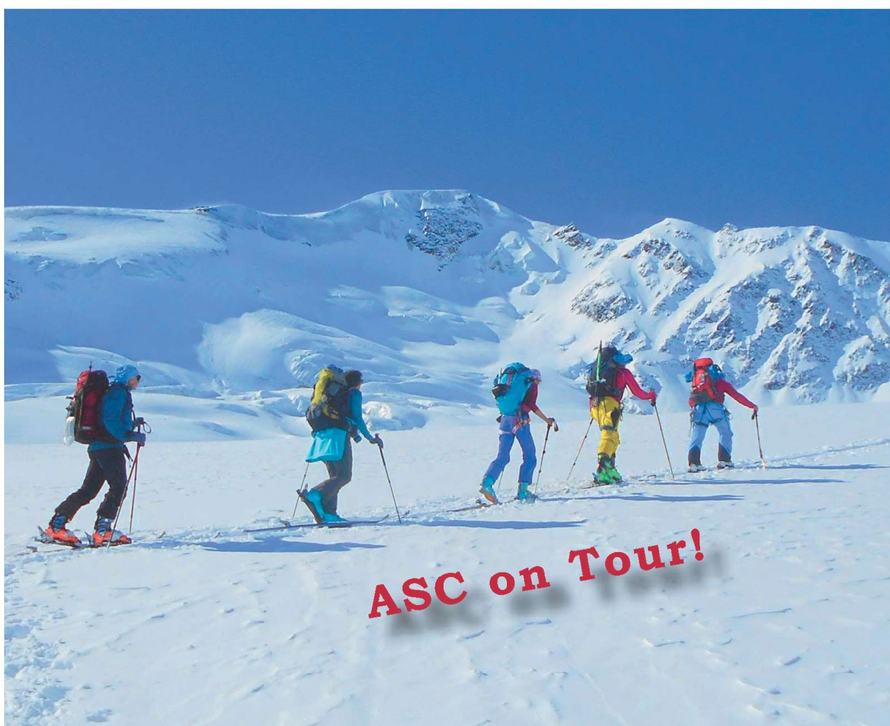
auf den Punta San Matteo