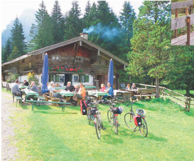
Auf der Amberger Hütte im März 2018