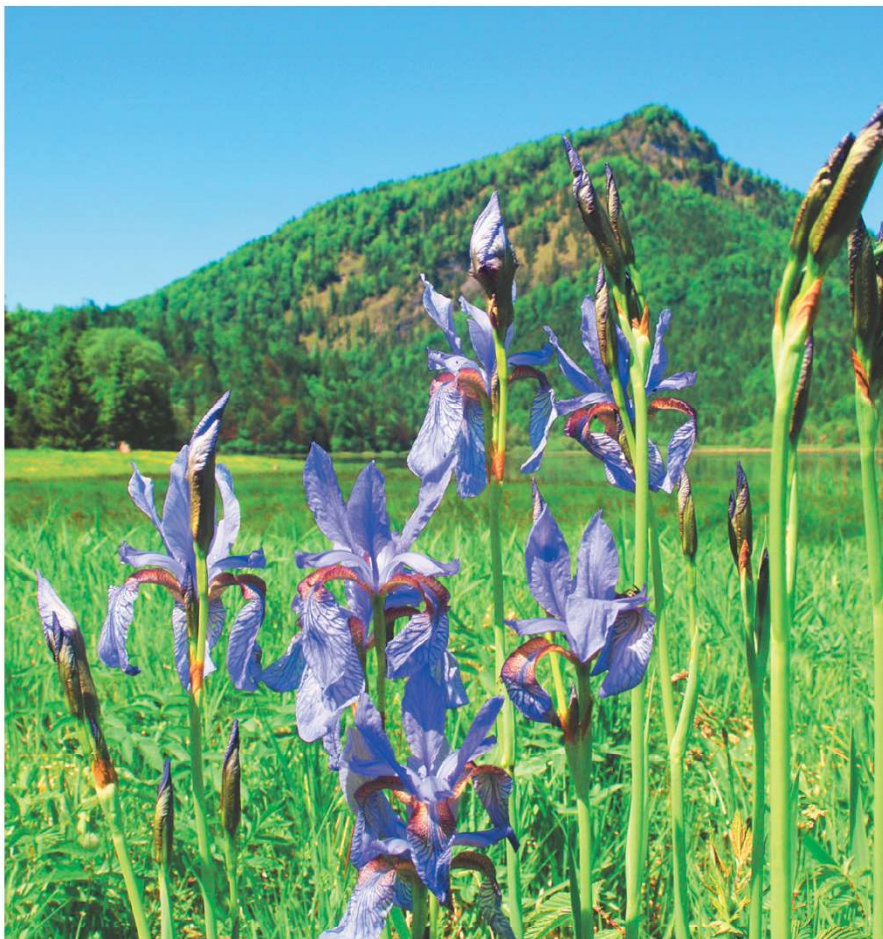
Blumenwanderung im Mai 2017 um den Weitsee